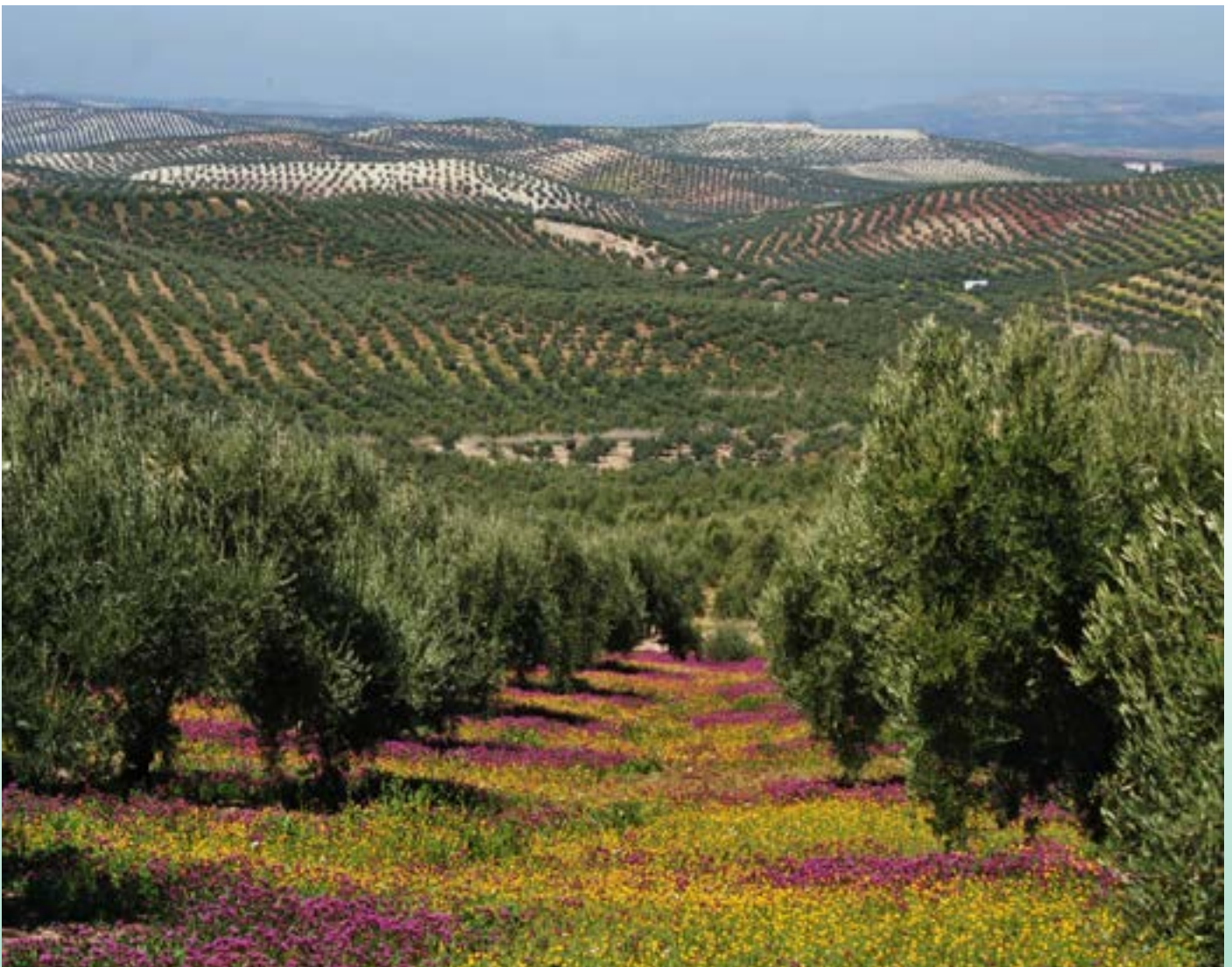
El mar de olivos que cubre toda la provincia de Jaén está compuesto por aproximadamente 580.000 hectáreas.

Memoria sobre la situación socioeconómica y laboral de la provincia de Jaén