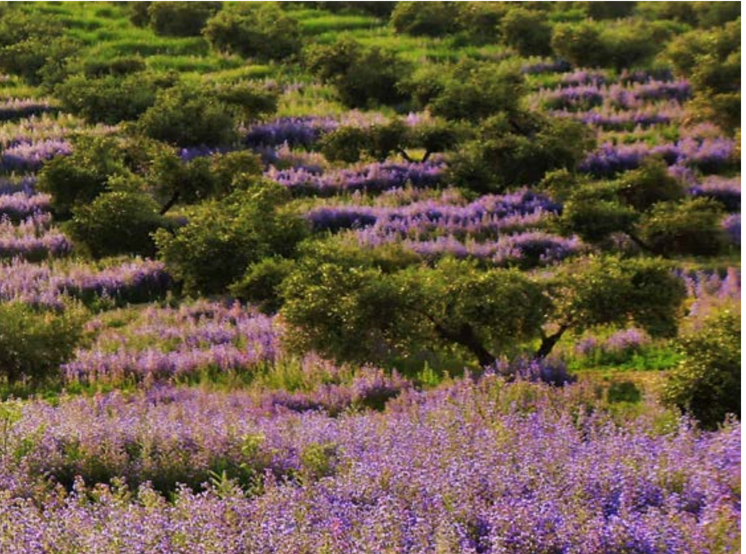
Los bosques de olivar ecológico, característicos por su cubierta verde, lo que propicia el mantenimiento de la biodiversidad.

consigan posicionarse en los mercados nacionales e internacionales. En relación al número de cooperativas en la provincia, el apartado de