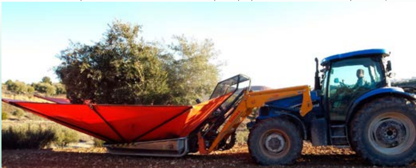
La maquinaria agrícola desarrolla cada año su I+D+i para ofrecer novedades y mejoras para próximas campañas.

Otras de las medidas aquí reseñadas pasan por fomentar la economía local sostenible, mediante el aprovechamiento de los recursos de cada municipio y con la participación de la ciudadanía e impulsar una mayor actividad empresarial ligada al aprovechamiento de los montes públicos. A lo que se suman el apoyo a nuevas formulas económicas adaptadas al presente y el futuro como la bioeconomía y la economía circular, estrategias fundamentales para propiciar el desarrollo empresarial, en el