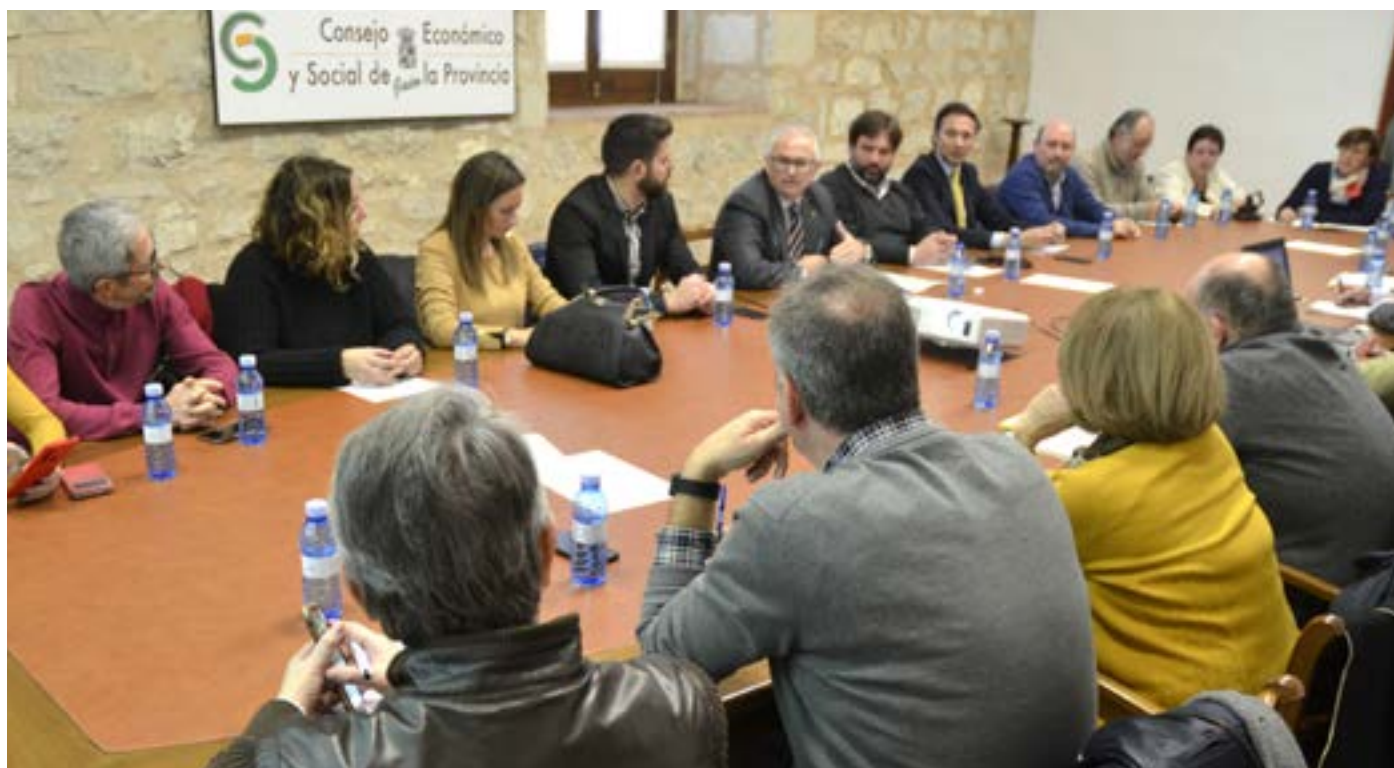
Un momento de la celebración del Pleno Ordinario del CES Provincial en Antiguo Hospital San Juan de Dios, el 22 de enero de 2020.

El Consejo Económico y Social de la Provincia de Jaén comenzó la actividad del nuevo año con la celebración de una Comisión Permanente y un Pleno Ordinario que tuvieron lugar a finales de enero. En el Pleno se dio lectura al informe del presidente, así como también a una propuesta en firme acerca de la planificación de actuaciones previstas a celebrar durante este 2020.